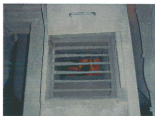
混和材専用投入口